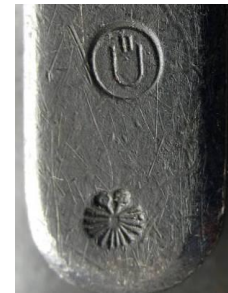
Ü – ? (I Republika Austrii 1934-38) Na haku pochwy