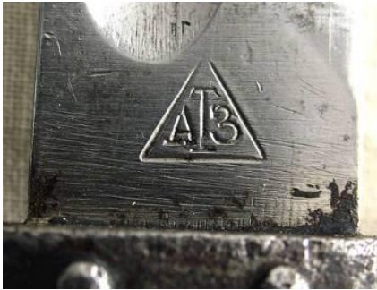
ATZ – wczesny Kragujevac Arsenal (Serbia)