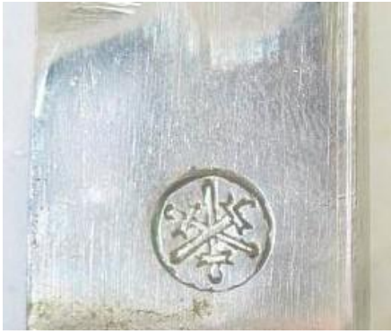
SORLINI Varaždin (Chorwacja)