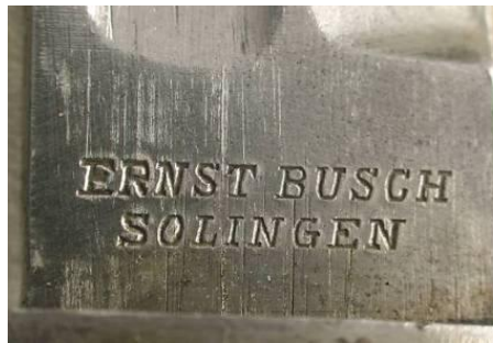
ERNST BUSCH SOLINGEN (Niemcy)