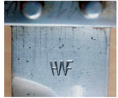
HWF – Wiener Heeres Fabrik (Austria)