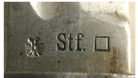
Stf. – Steyr – (I Republika Austrii 1934-38)