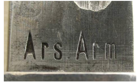
Ars. Arm – Arsenalul Armatei, Târgoviște (Rumunia)