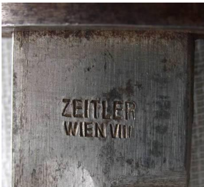
ZEITLER WIEN VIII (Austria)