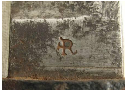
R – ?Resicka Wien, Na nożu wz. 17 przerobionym na bg. wz. 95 (Austria)