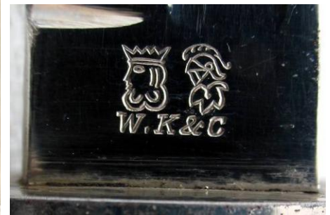
W.K&C – Weyersberg Kirschbaum & Companie (Niemcy)