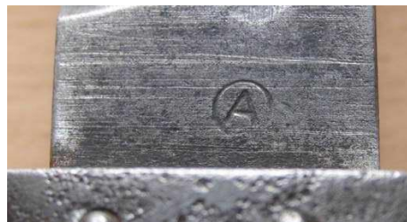
(A) – ?Znak kontroli