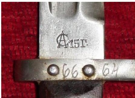
CA (SA) – ? Sofia Arsenal (Bułgaria)