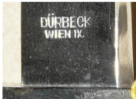
DÜRBECK WIEN IX. (Austria)