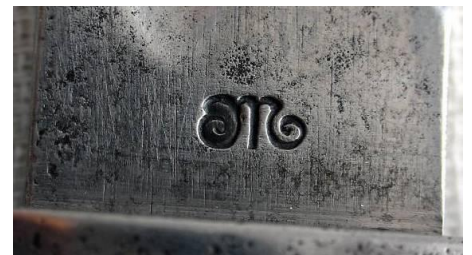
OMC - Genossenschaft Maschinenfabrik, Ferlach- Kärnten, Ostmark (Austria)