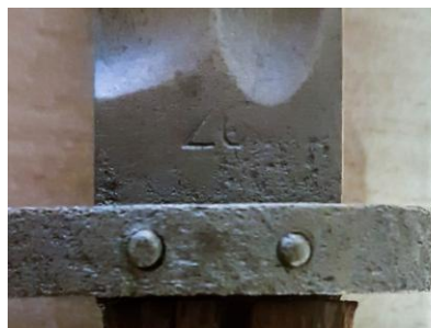
Zb Kr. (odmiana) – Zbrojownia Kraków (Polska)