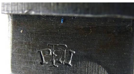
BFM - Berndorfska Fabryka Wyrobow Metalowych (Austria) Berndsdorfer Metallwarenfabrik, Berndorf