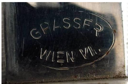
GRASSER WIEN VII. (Austria)