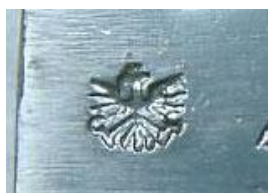
Orzeł I Republiki (1919 – 1934)