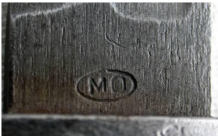
MO – Moravske Ocelarny Morawskie zakłady stalowe (Czechy)