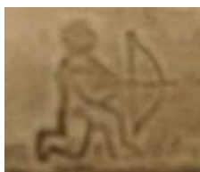
Winternitz – Steyr

Niekoniecznie na 95, ale może się przyda.