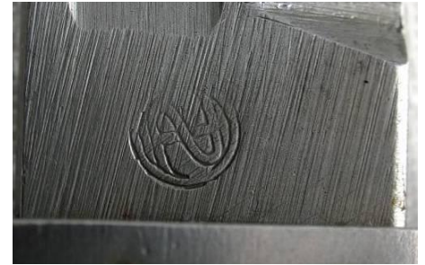
ZP – Zbrojowka Praga (Czechy)