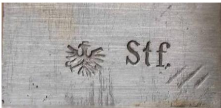
Stf. – Steyr – (I Republika Austrii 1919-34)