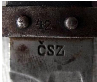
ČSZ – Czeska Zbrojowka (Czechy)