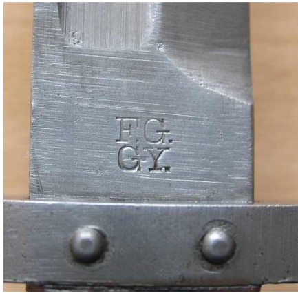
F.G.GY – Femaru Fegyver es Gepgyar Budapest (Austria)