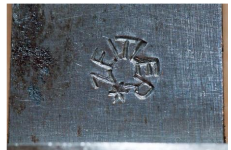
ZEITLER WIEN (Austria)