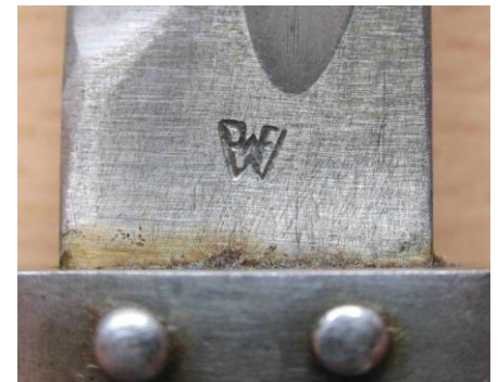
WNPF – Wiener Neustädter Patronenfabrik (Austria)

Jeszcze nie zebrane, o udokumentowanym istnieniu (zdjęcia z Internetu)