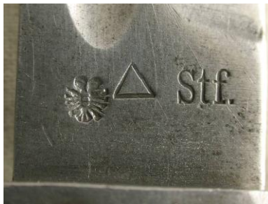
Stf. – Steyr – (I Republika Austrii 1934-38)