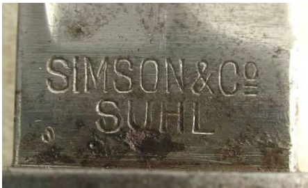
SIMSON & Co SUHL (Niemcy)