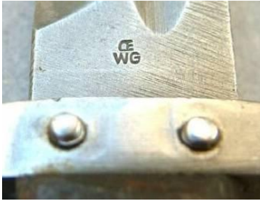
OEWG – Osterreichische Waffenfabrik Gesellschft, Steyr (Austria)