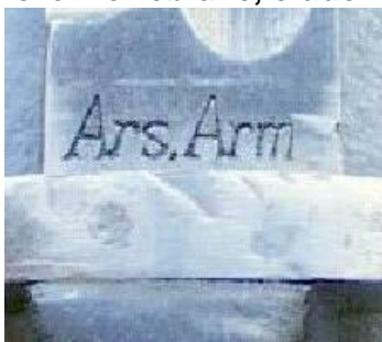
Ars. Arm (kursywa) – Arsenalul Armatei, Târgoviște (Rumunia)

Jeszcze nie zebrane, o udokumentowanym istnieniu (zdjęcia z Internetu)